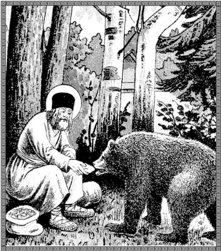
Preacuviosul Serafim hrănind ursul